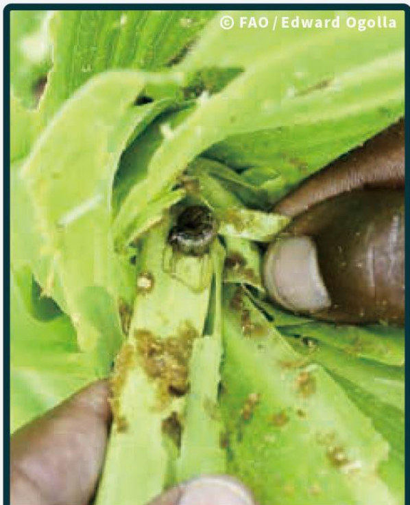
偏好啃食作物生長點，受害處留下大量糞便