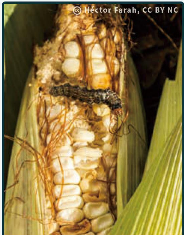
老熟幼蟲啃食玉米穗