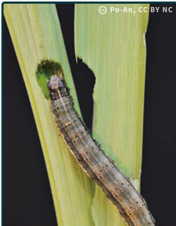
老熟幼蟲蛀食莖稈