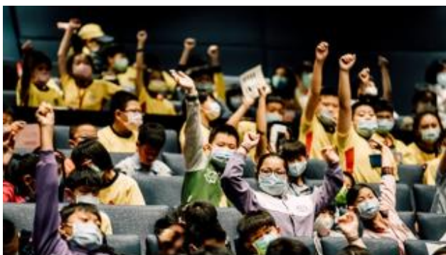
2020 臺中國家歌劇院「藝起進劇場—舞蹈篇」