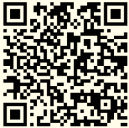
報名網址 QR CODE