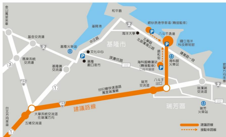
自行開車前往海科館 建議路線圖