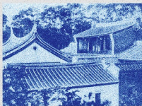
• 士林國小芝山巖學堂

為保存本土教育資源，國家教育研究院於民國96年起建置「百年老校」網頁，蒐集國內滿百年之學校紀念專刊，供民眾查詢使用，藉以呈現臺灣教育發展軌跡。